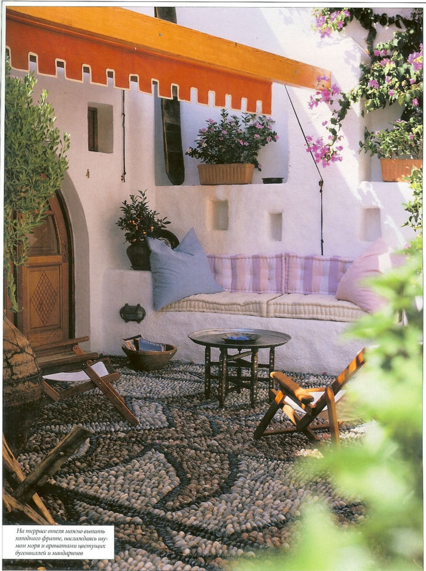
На террасе отеля можно выпить холодного фратте, наслаждаясь шумом моря и ароматами цветущих бугенвиллей и мандаринов